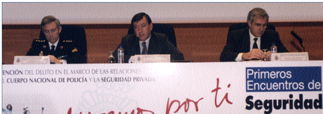
Aspecto de la mesa presidencial durante el acto de inauguración de los Encuentros.